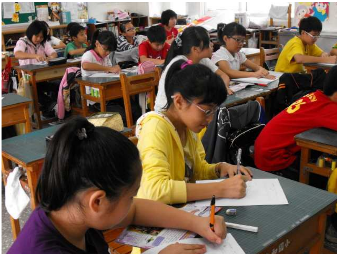
介紹夏卡爾的出生背景與生平小故事後，學生聚精會神完成夏卡爾學習單。