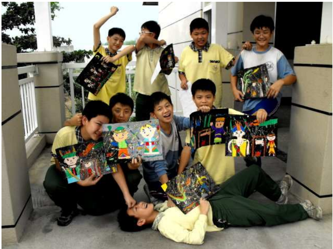
一陣刀光劍影，我的夏卡爾與台灣原住民合力擊垮了惡龍，綻放勝利的火花！