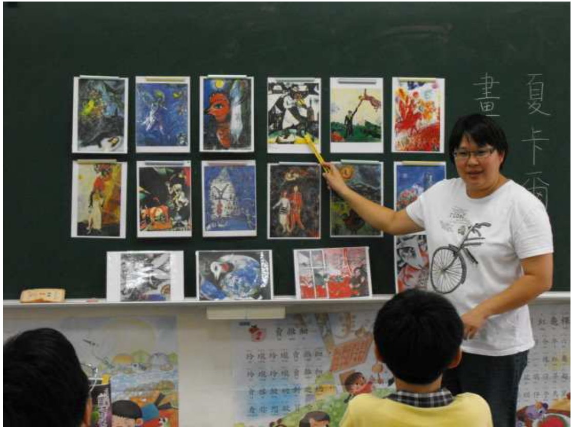
教師介紹夏卡爾幾幅名畫作，讓學童對夏卡爾的認識更深。