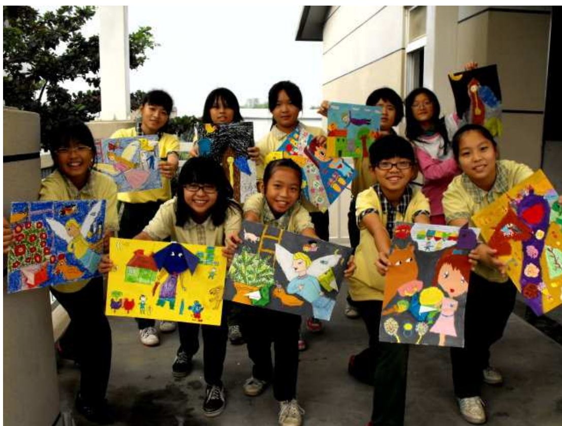
你看，圖畫裡的我躲在哪裡呢？下一個天才夏卡爾就是我啦！