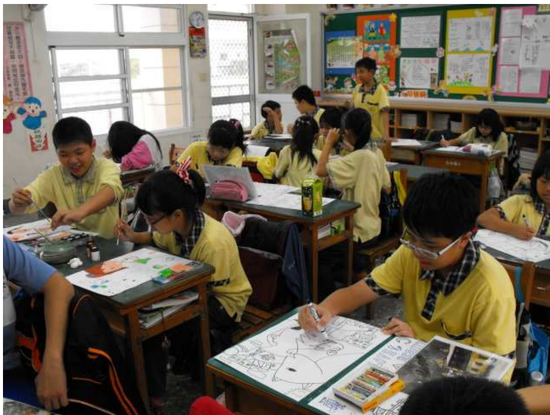
夏卡爾畫作仿畫，並添加摺紙降自己幻化為小動物隱身於圖畫中。