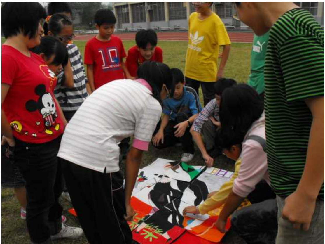
咦？怎麼拼不起來，原來有人畫錯啦！貝拉的頭斷了，夏卡爾好傷心呦！