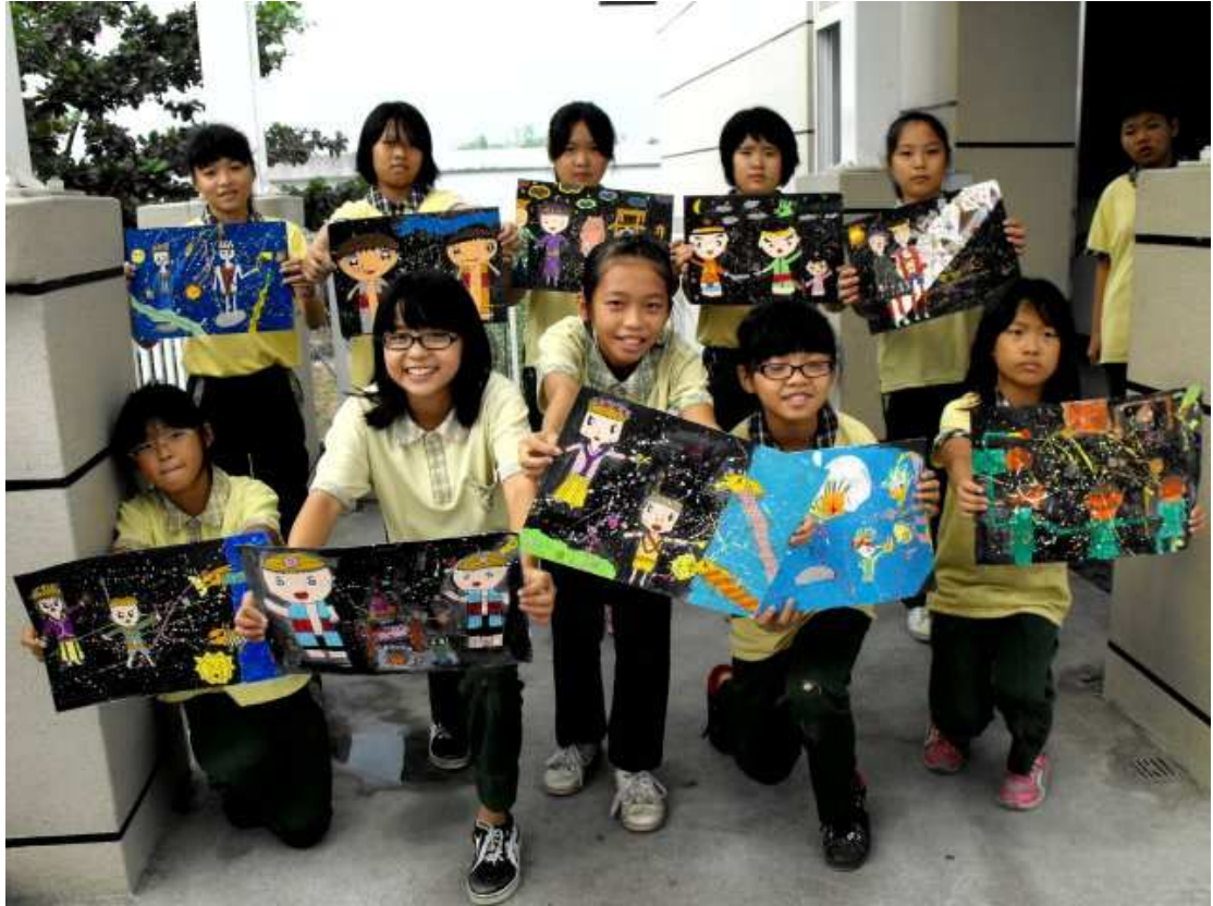
瘋狂甩色後黑底襯脫出亮彩，我的夏卡爾與台灣原住民一同綻放豐年慶功煙火！