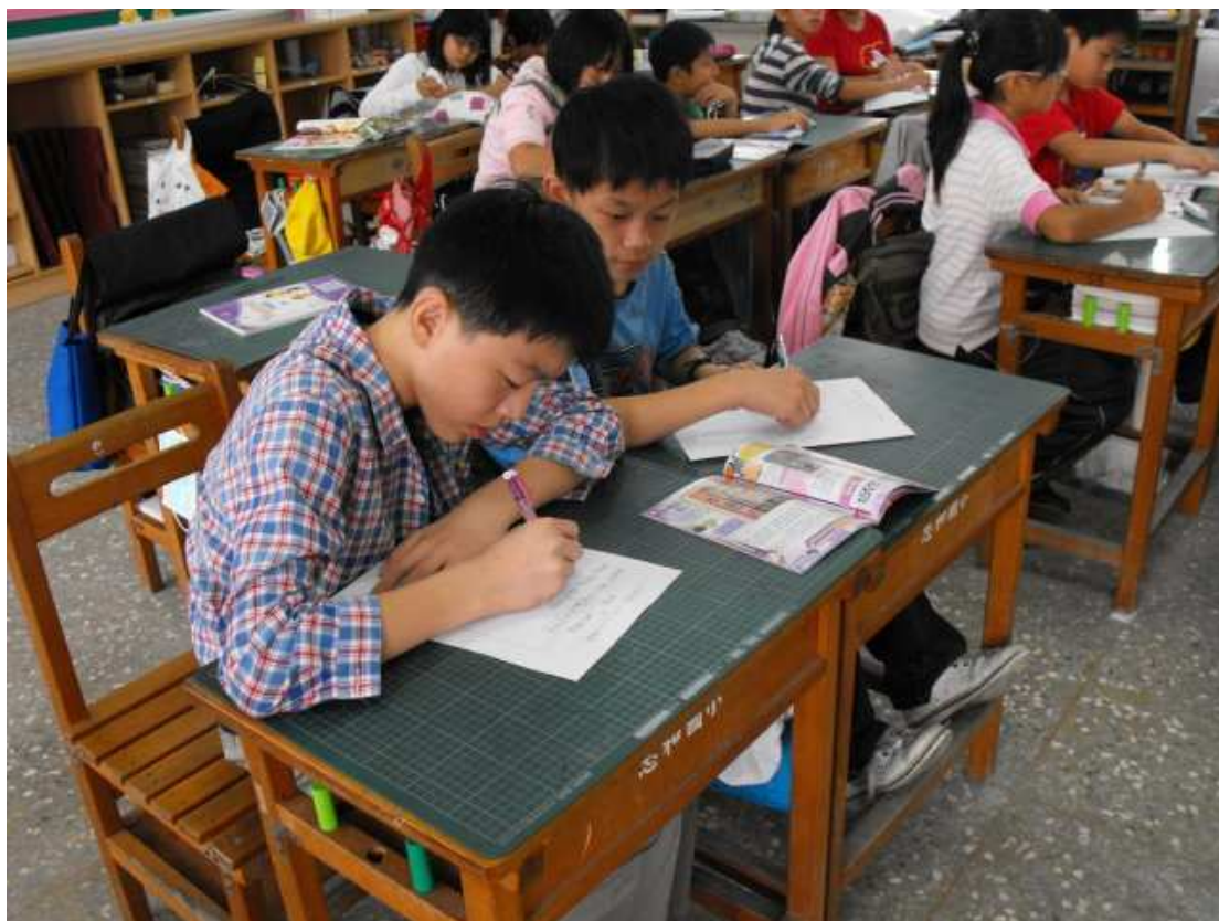
看完夏卡爾生平及畫作「七個指頭的自畫像」影片後學生聆聽整理筆記