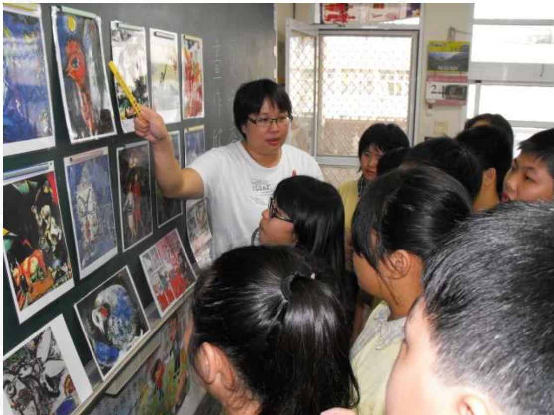
欣賞夏卡爾畫作，師生互相分享對夏卡爾畫風的想法