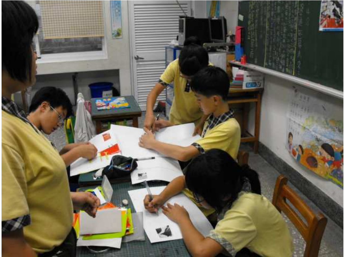
將夏卡爾「生日」畫作格放，希望透過合作學習，拼貼出巨幅作品。