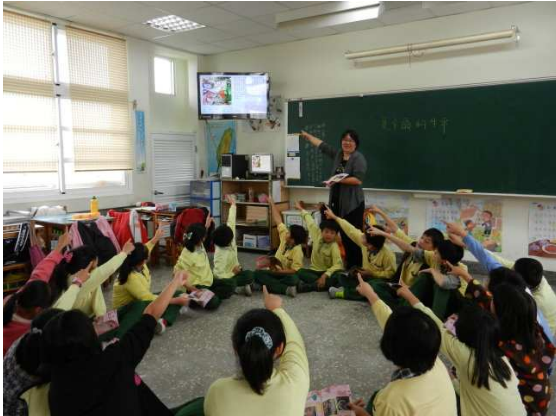
教師播放夏卡爾生平簡報，簡單介紹夏卡爾的一生。